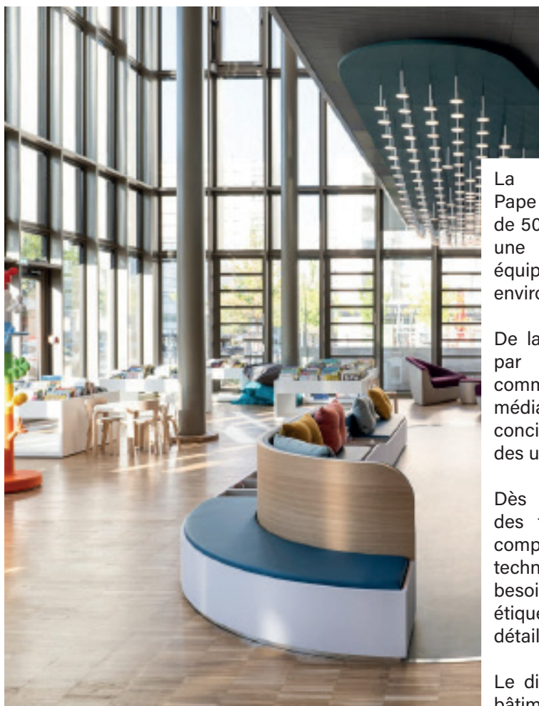
Façade en triple vitrage respirant avec stores intégrés